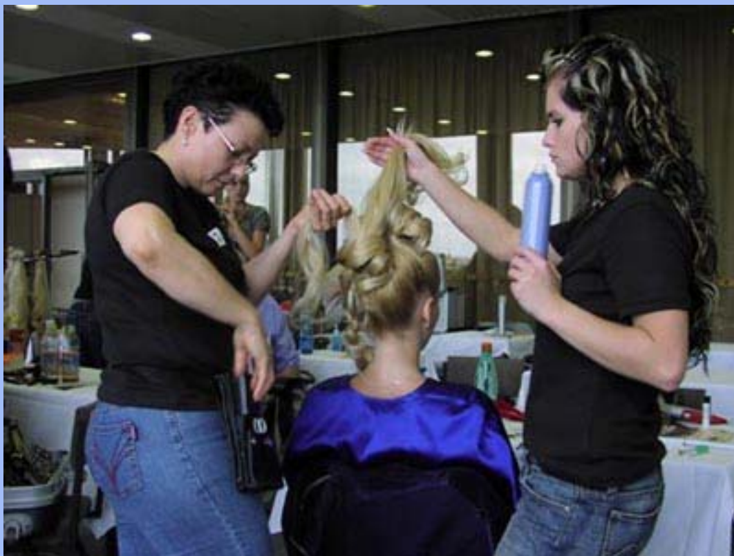
Závěrečný výčes z nastavených vlasů

V rámci veletrhu jste tak mohli vidět prodlužování vlasů různými technikami a následnou proměnu modelek a závěrečné vyhlášení nejlepšího účesu z prodloužených vlasů. Ve velkém sále měla program firma TIGI, jenž prezentovala své vlasové přípravky. Vydavatelství Nava na velkém podiu představila nový časopis Linda speciál – Svatební účesy 2006, 2007. Program byl velmi bohatý a pestrý a pokračoval ještě v sobotu 9.září.