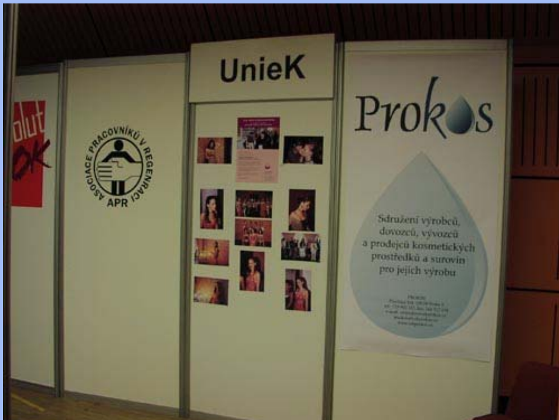
Naše logo na Beauty Expo 2006