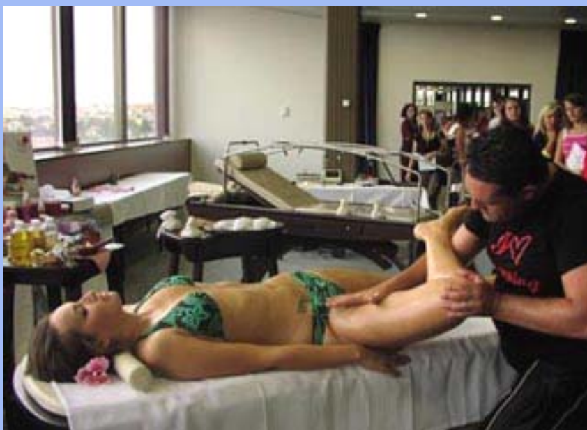
Masáže dolní končetiny

Pro informaci masérů, zmíněná italská firma prodává Bright Stone za 600 €. Zatím nejsou pořádána česká školení. Italové testují náš trh a v případě, že by bylo dost zájemců, kteří by si kameny pořídili, uspořádali by v Čechách školení. : )