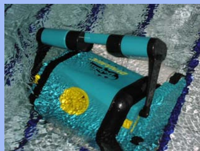
Dolphin v akci