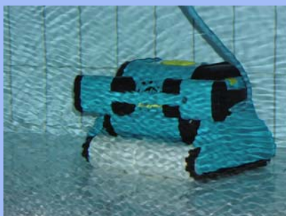
Podvodní vysavač Dolphin

Podvodní vysavače by měly být vždy nedílnou součástí vybavení bazénu, pro mnohé provozy jsou již nenahraditelné. Jsou dobrým doplňkem k fungující úpravě bazénové vody - recirkulační úpravnu vody však nemohou nahradit. Zajistí vám ale vanu bazénu bez usazenin, vlasů, zbytků náplastí a nánosů. Zlepší kvalitu vody v bazénu a sníží spotřebu chemikálií na úpravu vody. Pořídíte-li si na bazén vhodný vysavač, nebudete litovat vynaložených peněz. Brzy poznáte, že každý vysavač je dřič, kterého se vyplatí na bazénu vlastnit.