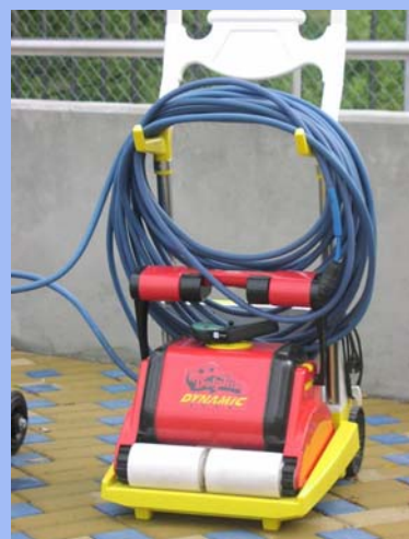
Vysavač Dolphin pro bazény do 25 m

Umožňují ovšem za vyšší cenu obě uváděné volby (obsluha s rychlejším vyčištěním nebo bez obsluhy práce v cyklu).