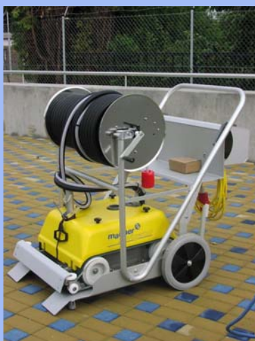
Vysavač Mariner pro aquaparky

Automatické vysavače postupně vysávají celý bazén bez zásahu obsluhy. Musí však pro vyčištění bazénu absolvovat celý cyklus tak, jak je naprogramován. Proto se většinou instalují v nočních hodinách, kdy je také neoptimálnější doba k čištění bazénu. Ke svému provozu nepotřebují ani obsluhu ani dozor. Po opuštění bazénu koupajícími se nechají nečistoty usadit (cca 1 - 2 hodiny) a pak se vloží vysavač do bazénu a uvede do provozu. Vysavač pracuje sám. Pokud má zabudovaný časový cyklus, tak se po ukončení provozní doby sám vypne a čeká, až ho někdo vyloví. Je-li bez časového vypínače (vakuové), pracuje stále až do vylovení. Automatické vysavače se rozlišují i podle schopnosti čistit pouze dno bazénu, či dokáží lézt a čistit také stěny bazénu.